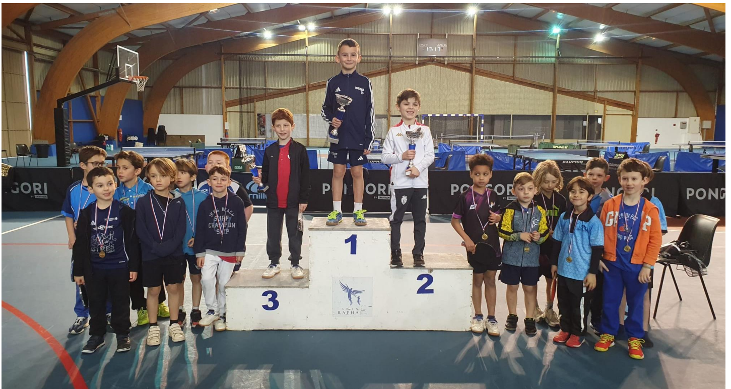
Podium 2017 et +