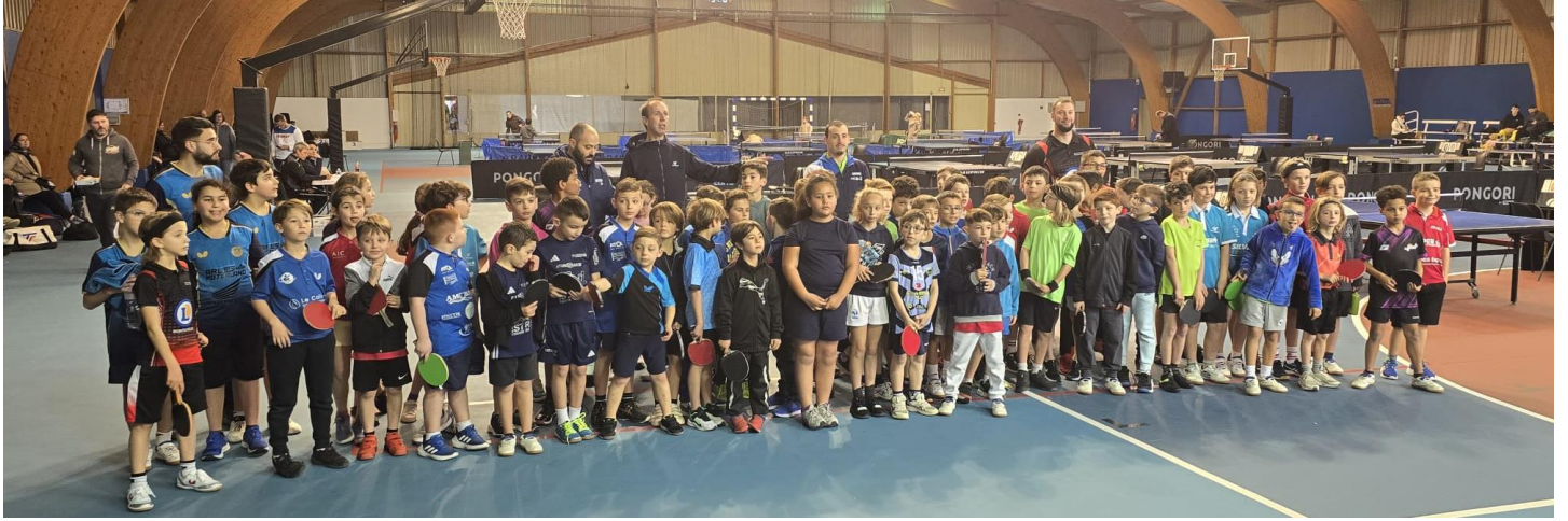
Ensemble des participants